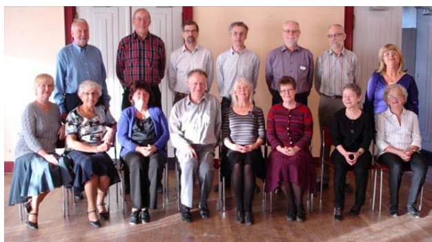
Tangogruppen med ett besökande par

Nu är gruppen intresserad av Foxtrot (Slowfox som det egentligen är) och vi planerar att lära ut det samtidigt som vi bygger på och håller tangon vid liv. Se flyer: Terminskurs I Park: Tango och Foxtrot sid 17.