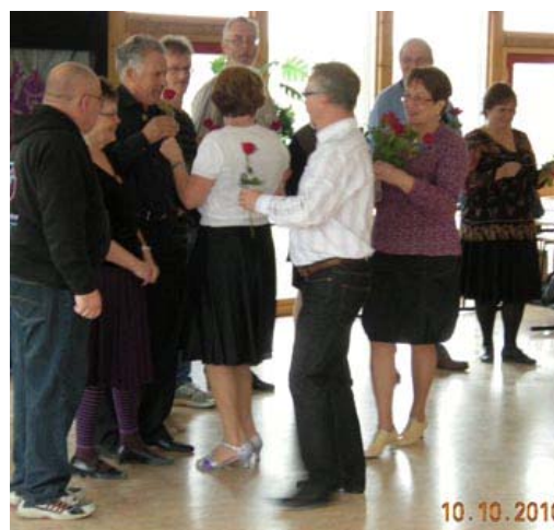
Staben som gjorde ett utmärkt arbete avtackas

Man samarbetar fint i Märsta. Även square-dansare var med och jobbade åt oss rounddansare.