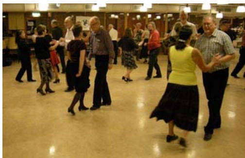
Här sväger det fint på golvet