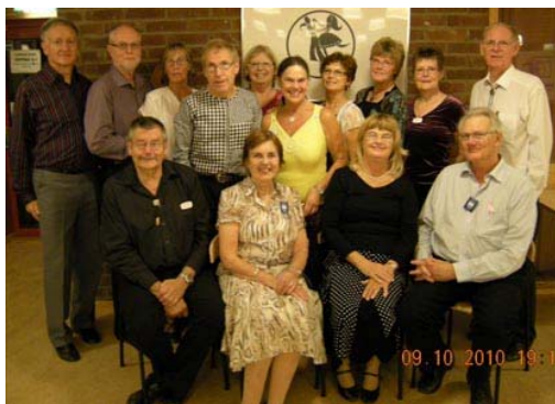
De deltagande Bagisdansarna samlades för foto

ett lyckat höstmöte genomfördes i Märsta 8-10 oktober. Allt fungerade alldeles utmärkt och musikanläggningarna återgav både cueing och musik både härligt och tydligt.