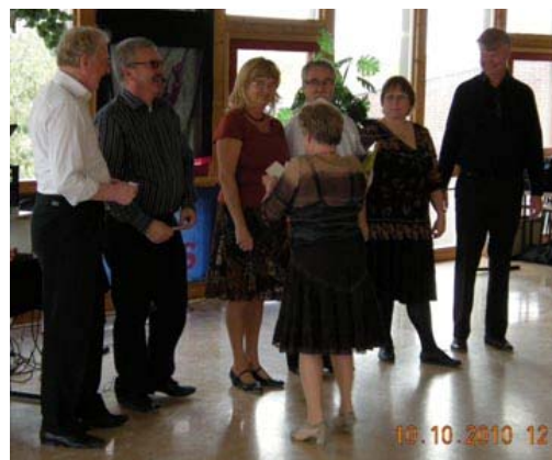
Alla cuers avtackades