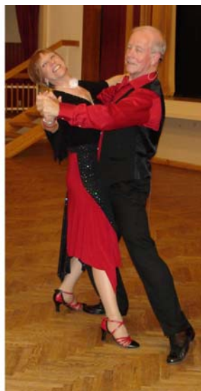
Right Lunge with Change of Sway