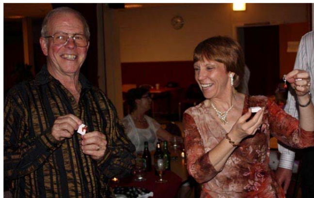
Hurd of Horses

Våra härliga, outtröttliga ledare avtackades med a "Hurd of Horses" i form av svenska Dalahästar. Väl valda presenter som gjorde succé.