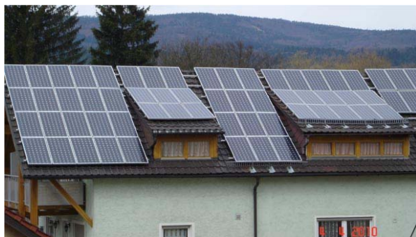
Solpanel på taket, varför inte i Sverige?

Veckan började som vanligt med en utflykt nu till Furth im Wald, en liten stad nära gränsen till Tjeckien. Till skillnad från Sverige ser man väldigt många tak fyllda med solpaneler.