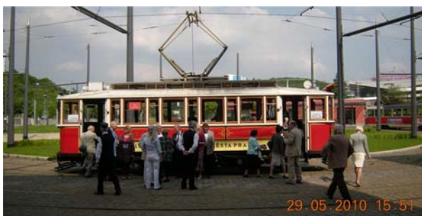
50-årig spårvagn i Prag

Höjdpunkten var en 2-timmars rundtur i en 50-årig, välrenoverad spårvagn. Konduktören kunde köra spårvagnen kors och tvärs på befintliga spår, passerande storögda, reguljära passagerare. Imponerande! På kvällen serverades en 7-rätters middag på en höjd med utsikt över hela staden.