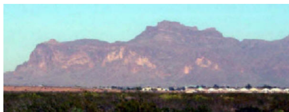
Vilka färger! Superstition Mountain i Mesa

En plats som de dock tillbringar mycket tid och har reguljära kurser är Mesa, Arizona.