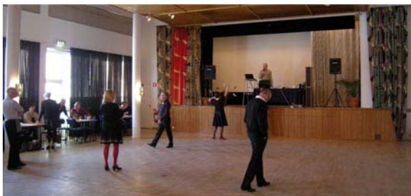
Ljudet i den fina Filmsalen kontrolleras inför dansen

Vi dansade som vanligt i två hallar. Nytt var dock sättet att ta sig mellan dessa, som innebar en liten promenad i solen men med knaster under fötterna.