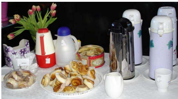
Bullfatet stod aldrig tomma. Smörgåsar och frukt serverades också.

Vi möttes av fyllda bullfat och nya idéer när vi steg in genom dörren i det välkända Gullberna. Entréhallen gick dock inte att känna igen. Den liknade snarare ett franskt kafé med hög mys känsla.