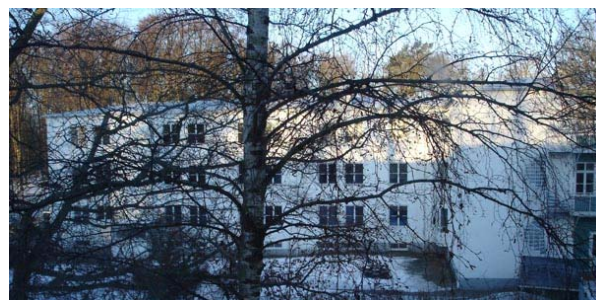
Utsikt från rummet