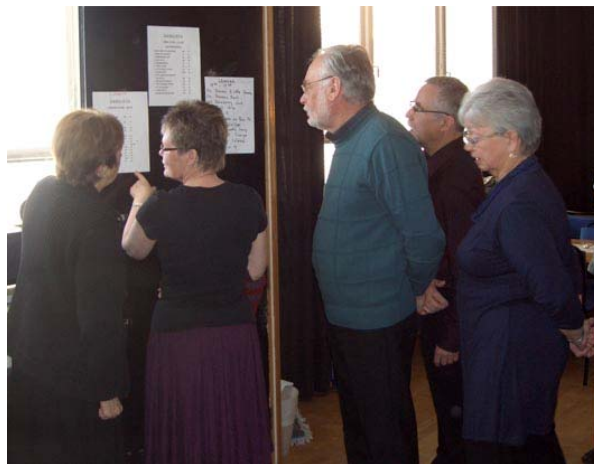
Ett gäng som undrar: "Vilka danser kan det bli?"