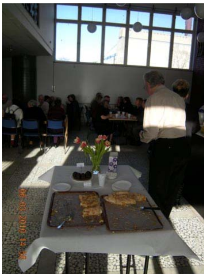
Def franska kaféet är flitigt besökt

Det märks direkt att Karlskronadansarna är ett väl inarbetat team. Alla jobbar febrilt med olika verksamheter utan att någon behöver dirigera. Idel glada ansikten.