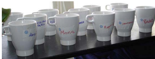
Inte bara mys utan också tanke. Poslinskoppar till var och en spar både miljö och kostnader!