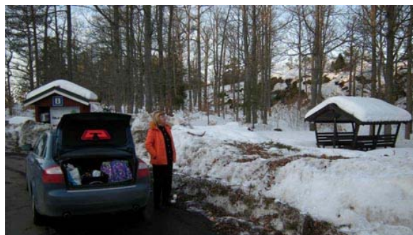
Inga toaletter och inga rastplatser var tillgängliga

Som genom ett trollslag mojnade snöstormen precis när det var dags att packa för resan till Karlskrona! Himlen sprack upp och den nästan bortglömda solen visade sitt strålande ansikte.