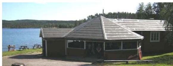
Malingsbopaviljongen och hela anläggningen

Där vid en av dessa vackra sjöar, inramad av raka granar, ligger plötsligt paviljongen! Men vi har tid över och susar vidare några hundra meter för att checka in i vår mysiga stuga på campingen. Sedan tillbaka i god tid.