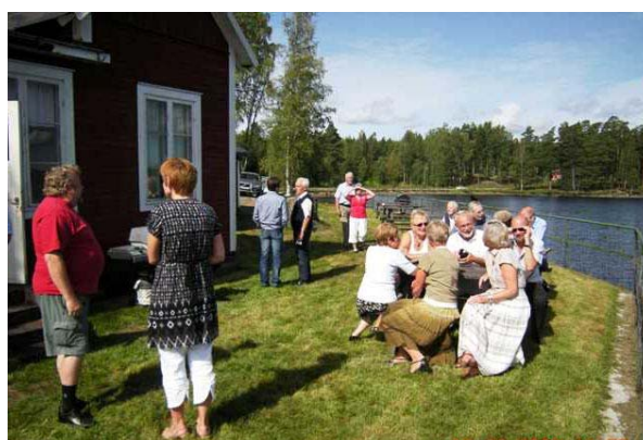
Efterhand blev det allt fler fikande glada människor

Kontinuerligt fika var en mycket effektiv och bra idé! När man än kom fanns fika framdukat.