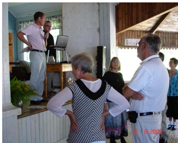
Alla hälsas välkomna av värden och välkommen kände man sig verkligen